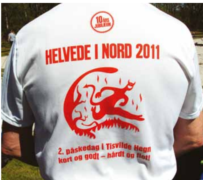
Alle løbere fik i anledningen af 10 års jubilæet en løbe t-shirt, som fint beskriver de to distancer: kort og godt – eller hårdt og flot.

Med udsigt til den smukke natur ved Tisvilde Hegn kæmpede deltagerne sig gennem den 10. udgave af det legendariske løb 'Helvede i Nord' under forårssolens varme stråler.